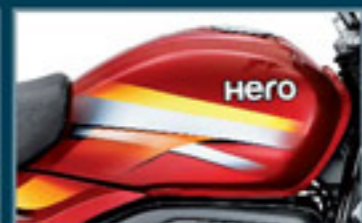
Bombom Blazing Red