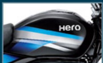
Preto com Listras Azuis

Disponível nas seguintes cores com gráficos novos e excitantes: