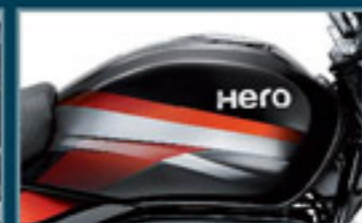
Preto com Listras Vermelhas