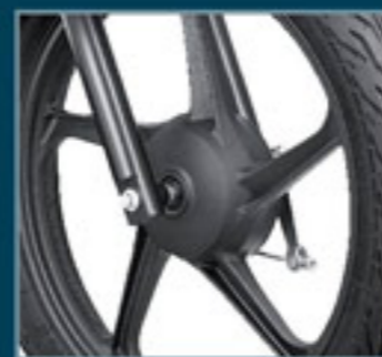
Rodas de liga leve pretas