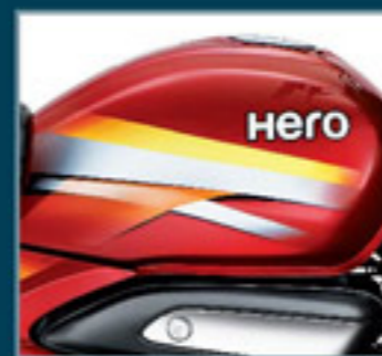
Tanque de combustível elegante com gráficos atraentes