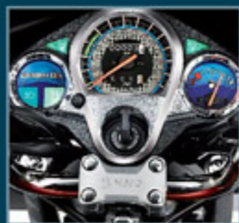
Console elegante com medidor de combustível